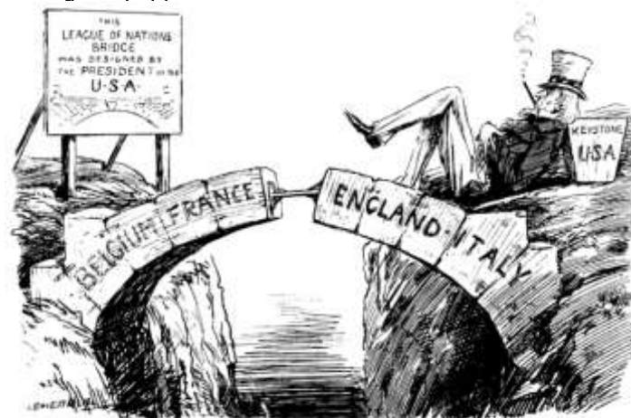
THE GAP IN THE BRIDGE.