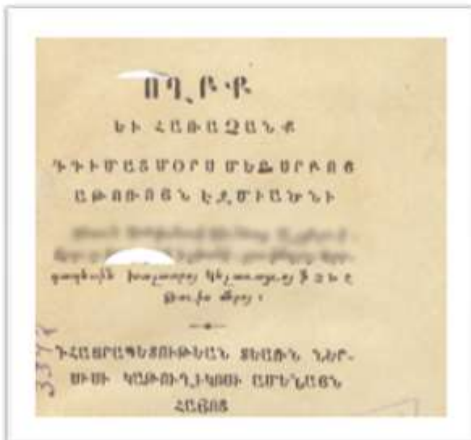
№ 17 Շարադրանք (2 միավոր)