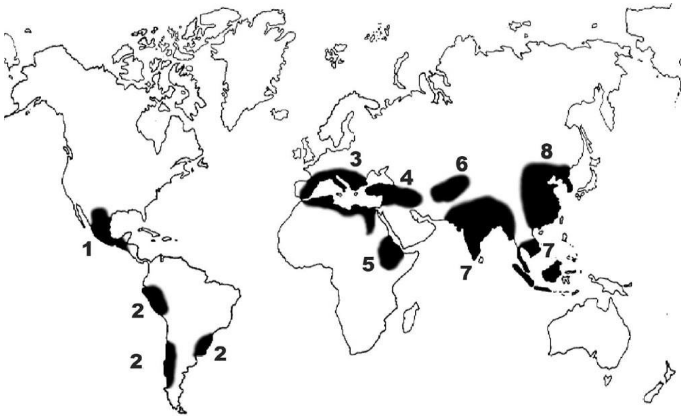
Առարկայական հանձնաժողովի նախագահ՝ Վ. Ասատրյան